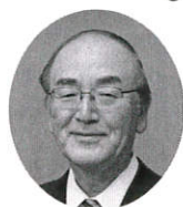
日本商工会議所 会頭 三村 明夫