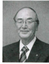
日本商工会議所 会頭 三村 明夫