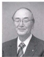
日本商工会議所 会頭 三村 明夫