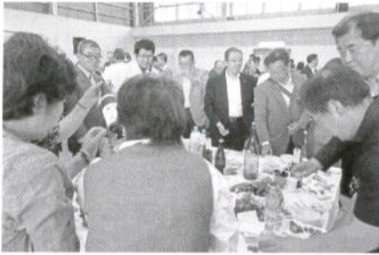
総務企業委員会の皆さんにも御参加頂きました

花巻市石鳥谷町は、日本三大杜氏（南部・越後・丹波）の一つ、南部杜氏の里として多くの名杜氏を輩出しています。このような歴史的な背景のもと、「南部杜氏自醸清酒鑑評会」で受賞した吟醸酒等を賞味できる南部杜氏の里まつり（旧石鳥谷酒まつり）が花巻市・南部杜氏協会・花巻商工会議所石鳥谷支所等で構成された「南部杜氏の里まつり実行委員会」の主催で、今年は去る5月27日（土）、ピバハウスいしどりやを会場に開催され、南部杜氏が丹精込めて仕上げた酒を、市内外から駆け付けた来場者約300人が、じっくりと味わいました。15テーブルに10～12本ずつ置かれた計170本の新酒を、参加者が順繰りに回っ