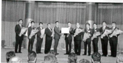
記念式典を挙げる