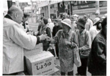
先着者プレゼント!

5月28日(日)、花巻市上町通りにおいて「第28回どでびっくり市in花巻」が開催されました。10時30分から始まる先着者プレゼントには長蛇の列ができ、佐々長醸造(株)のお醤油はあっという間に振る舞われました。会場には、海産物や山の幸、野菜、お肉、衣料品、雑貨など市内外から37店が出店し、文字通りびっくり価格で販売されました。また、イベントとして花巻中学校のプラスバンドの演奏、温泉足湯コーナーが設けられ、会場は大いに賑わいました。