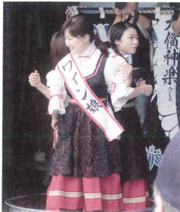
大迫ワインまつり