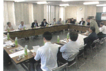
大田原商工会議所との意見交換

られた地酒が観光資源となっていました。長い歴史を持ち、日本有数の鮎漁獲高を誇る清流那珂川など豊かな水と緑ある自然を生かした取り組みは、花巻市においても類似点が多く、勉強になる有意義な研修となりました。