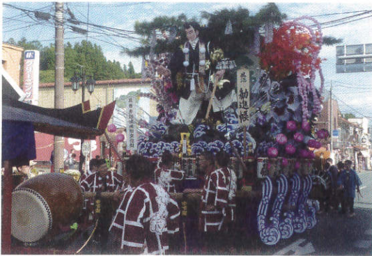
石鳥谷まつり 山車パレード