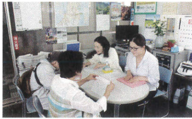
販売初日から盛況

9月24日(火)より花巻市プレミアム付商品券の販売が開始しました。これは、10月1日からの消費税率引上げによる影響の緩和を目的で発行され、低所得者及び子育て世帯を対象にしています。当会議所本所及び各支所をはじめ、なはんプラザ、イトーヨーカドー花巻店にてお買い求めいただけます。対象者お一人に20,000円(1枚500円×10枚綴りを5セット:5,000円上乗せ25,000円分使用可能)を限度に販売します。利用期間は、令和元年10月1日(火)から令和2年2月29日(土)までとなります。利用可能な登録店については、花巻市役所HPをご確認下さい。