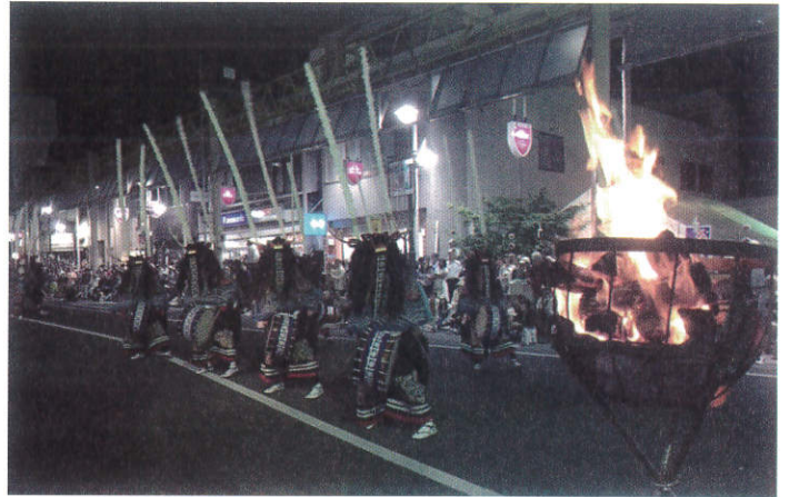
花巻まつり 群舞かがり火鹿踊り