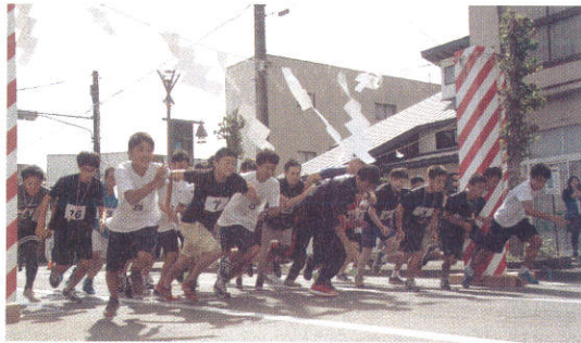
石鳥谷まつり 第40回記念 福男