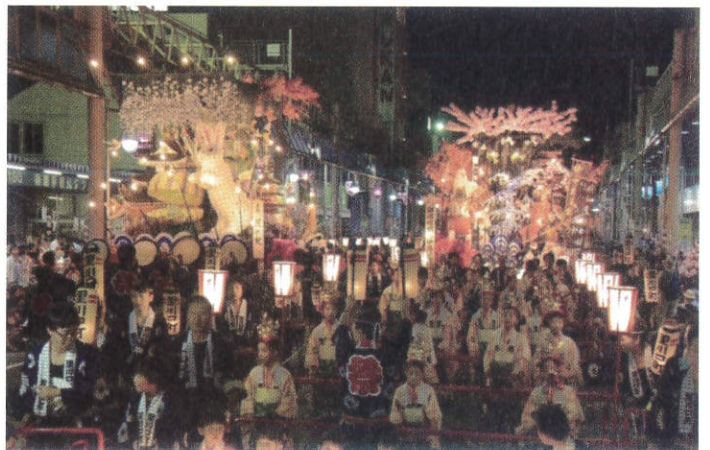
花巻まつり 山車連合パレード