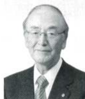
日本商工会議所 会頭 三村 明夫