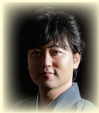
◇武田 双雲 / たけだ・そうらん

1975年熊本生まれ。東京理科大学卒業後、NTTに就職。約3年後に書道家として独立。NHK大河ドラマ「天地人」や世界遺産「平泉」など、数々の題字を手掛ける。講演活動やメディア出演のオファーも多数。ベストセラーの『ポジティブの教科書』のほか、著書は50冊を超える。2013年度文化庁から文化交流使に任命され、ベトナム・インドネシアにて、書道ワークショップを開催、17年にはワルシャワ大学にて講演など、世界各国で活動する。近年、現代アーティストとして創作活動を開始し、15年カリフォルニアにて、アメリカ初個展、19年アートチューリッヒに出演、20年には、ドイツ、代官山ヒルサイドフォーラム、日本橋三越、大丸松坂屋（京都店・心斎橋店）、GINZA SIX、伊勢丹新宿店にて、個展を開催し、盛況を博す。