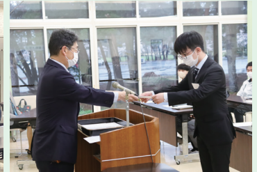
市村専務より修了証書を受け取る受講者