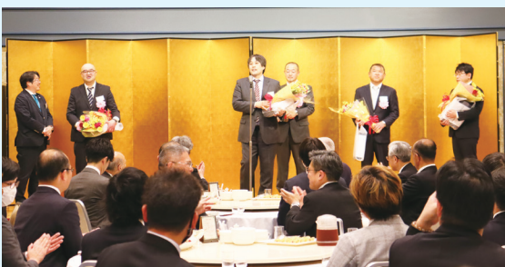
YEGでの思い出を語る卒業生