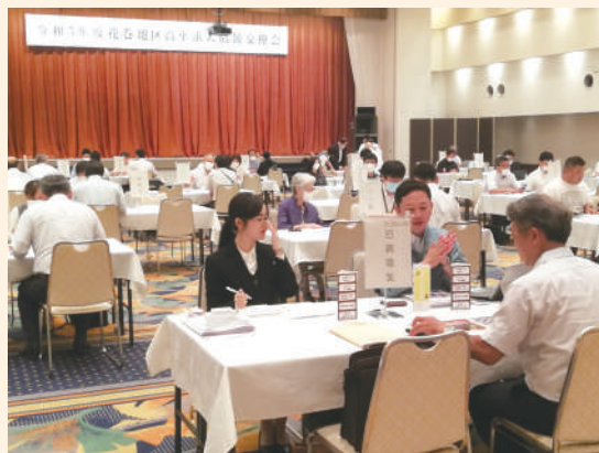
管内事業所56社が参加

会場では、各校の教諭が事業所のブースを回り、採用担当者から企業内容や福利厚生、高校生の求職情報や企業が求める人物像など、積極的に情報交換を図っていました。