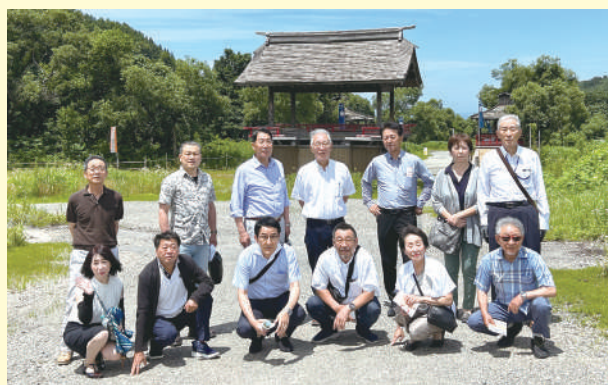
まるで歴史の世界に入り込んだ！？オープンセット

また、日本三大文殊のひとつとして知られている「亀岡文殊堂」、開山約1300年の歴史を持つ「慈恩寺」など山形県内の歴史ある名所を巡りました。