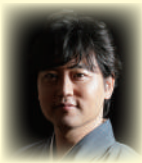
◇武田 双雲 / たけだ・そうらん

1975年熊本生まれ。東京理科大学卒業後、NTTに就職。約3年後に書道家として独立。NHK大河ドラマ「天地人」や世界遺産「平泉」など、数々の題字を手掛ける。講演活動やメディア出演のオファーも多数。ベストセラーの『ポジティブの教科書』のほか、著書は50冊を超える。2013年度文化庁から文化交流使に任命され、ベトナム・インドネシアにて、書道ワークショップを開催、17年にはワルシャワ大学にて講演など、世界各国で活動する。近年、現代アーティストとして創作活動を開始し、15年カリフォルニアにて、アメリカ初個展、19年アートチューリッヒに出席、20年には、ドイツ、代官山ヒルサイドフォーラム、日本橋三越、大丸松坂屋（京都店・心斎橋店）、GINZA SIX、伊勢丹新宿店にて、個展を開催し、盛況を博す。