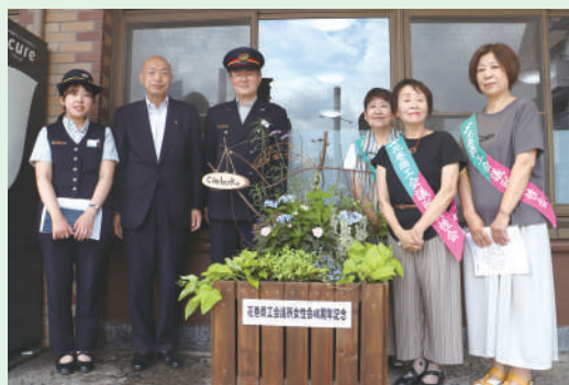
花巻駅前の寄せ植えで記念撮影

花巻の名前にふさわしい花のあるまちにと願い、JR花巻駅以外には、石鳥谷駅前・土沢商店街・花巻商工会議所大迫支所前に、各支部すべて違うデザインにて花巻のまちを彩っています。