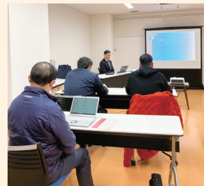
ハイブリット開催

当日参加された方々からは、「アイデア出しに活用したい」「対話を通じて自分の考えを深めていくために使いたい」などの感想をいただき、好評を博しました。