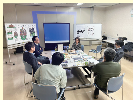
意見を出し合う参加者

また、今後どのように花巻ブランドを確立していくのかについても参加者で意見を出し合い、来年度も引き続き花巻オリジナルのデザインを検討していく方向性でまとめられました。