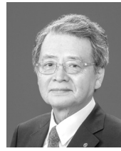
日本商工会議所 会頭 小林 健