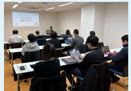
熱心に聴講する受講者

また、講義終了後の質疑応答では多くの質問が寄せられるなど、非常に有意義な時間となりました。