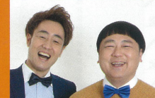
よしもと岩手県住みます芸人 アンダーエイジ