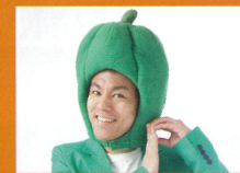
花巻観光応援団 よこっちピーマン