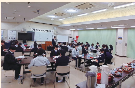
協力して課題解決に取り組む様子

参加者にとっては、実践的な内容を通じて社会人としての自覚を深める有意義な機会となりました。