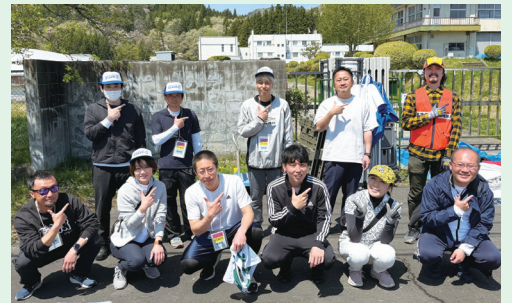
終了後の集合写真