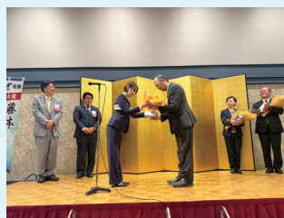
卒業生へ記念品を贈呈