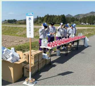
準備を終え走者を待つ 高校生スタッフ